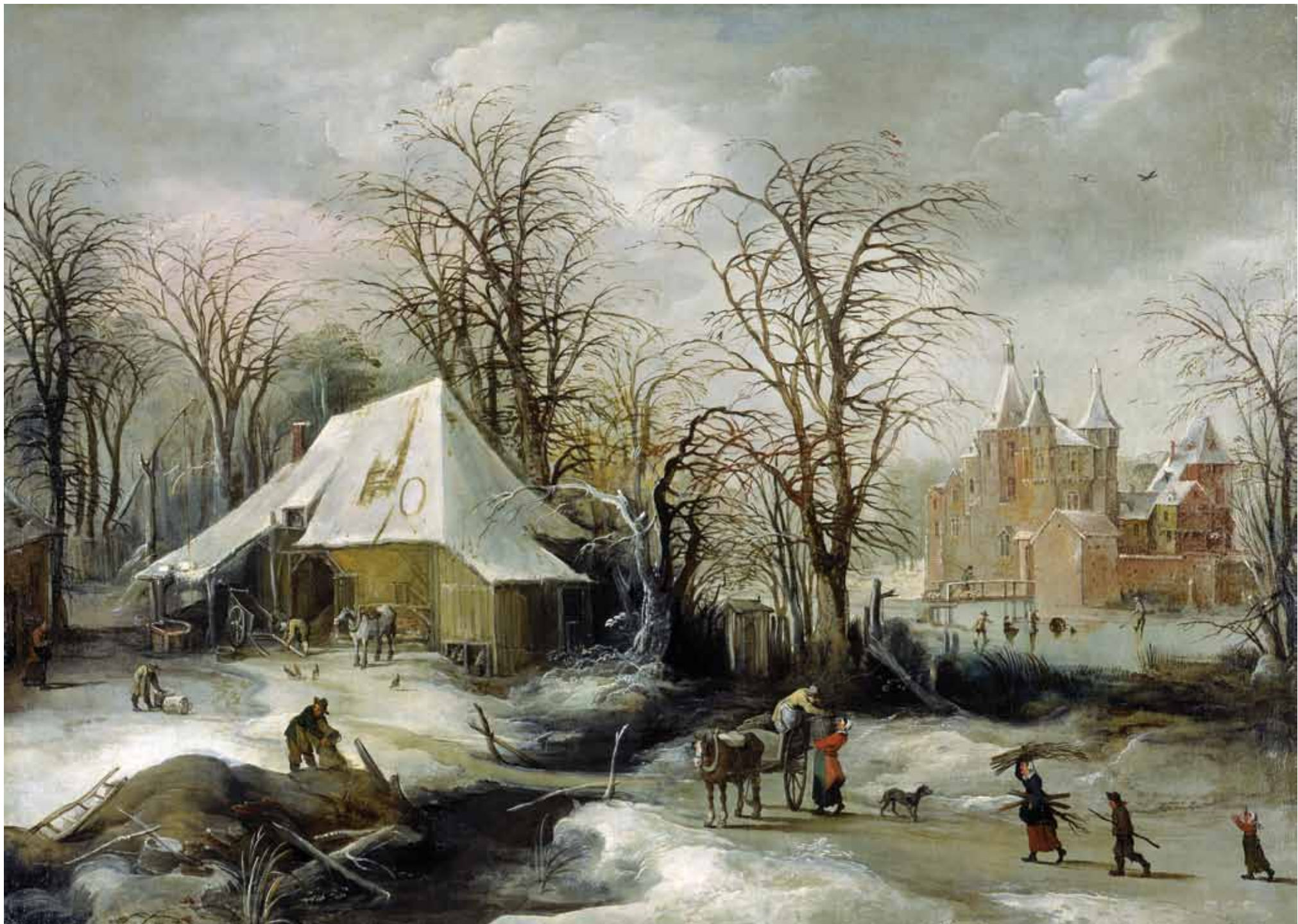
Joose de Momper II (el Joven), Winter Landscape , cerca de 1625-1630, óleo en tela, 46½ × 65⅞ pulg., comprado con fondos del estado de Carolina del Norte