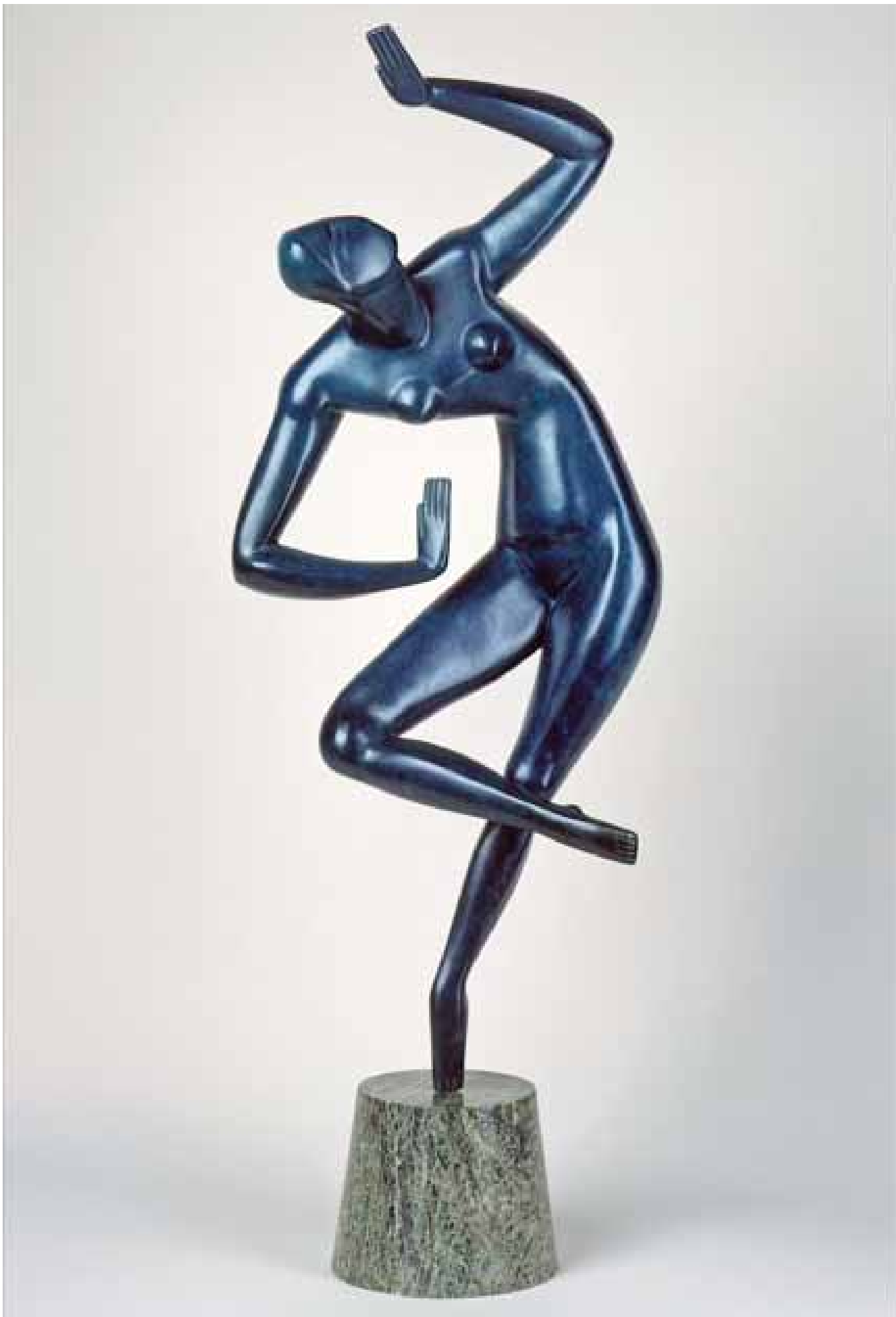
Alexander Archipenko, Blue Dancer , moldeado 1913-1918, vaciado después de 1961, bronce con pátina azul, base de mármol, 41 × 18 pulg., comprado con fondos del estado de Carolina del Norte