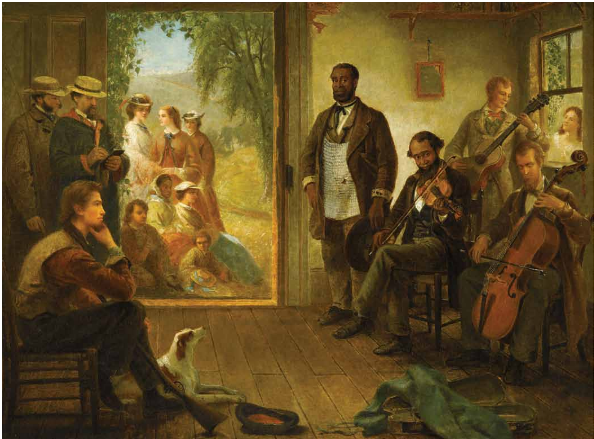
Thomas Hicks, The Musicale, Barber Shop, Trenton Falls, New York (detalle), 1866, óleo en tela, 25 × 30 1/8 pulg., comprado con fondos del estado de Carolina del Norte