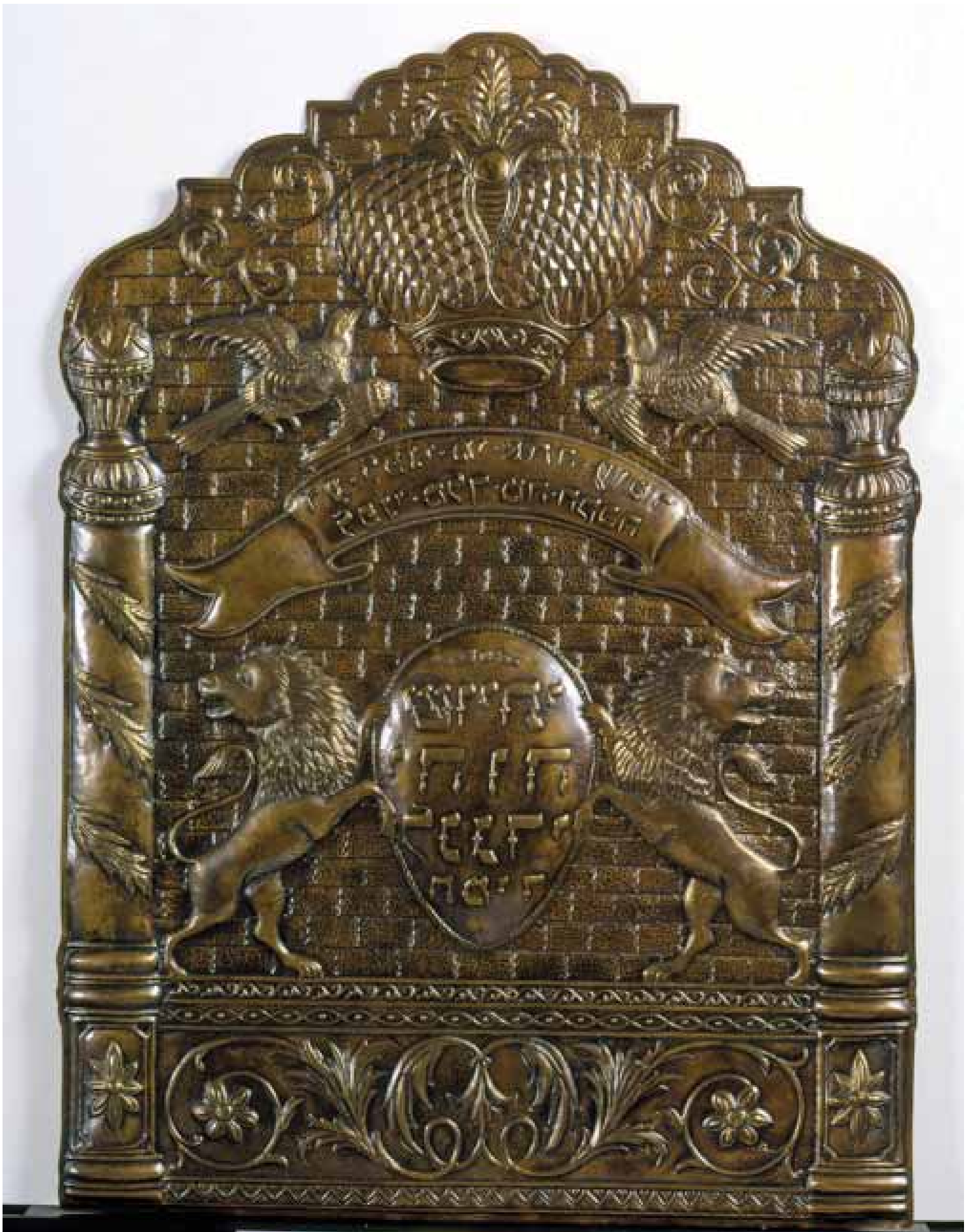
Placa de pared oriental para sinagoga, finales del siglo XIX - inicios del siglo XX, bronce, 31 \frac{1}{8} × 23 pulg., compra del museo, Judaic Art Fund y fondo para compras del museo