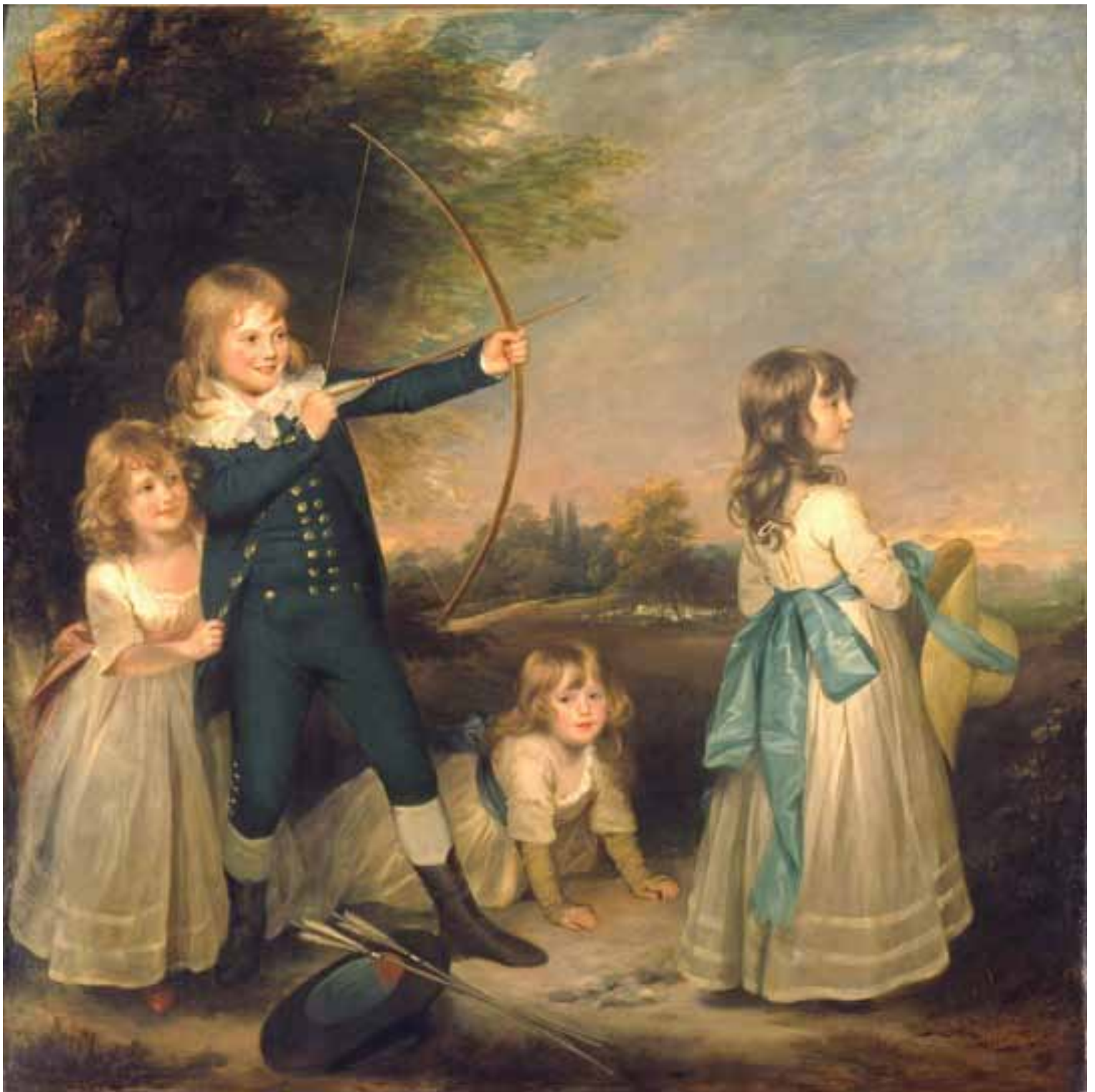
Sir William Beechey, The Oddie Children , 1789, óleo en tela, 72 × 71 7 / 8 pulg., comprado con fondos del estado de Carolina del Norte