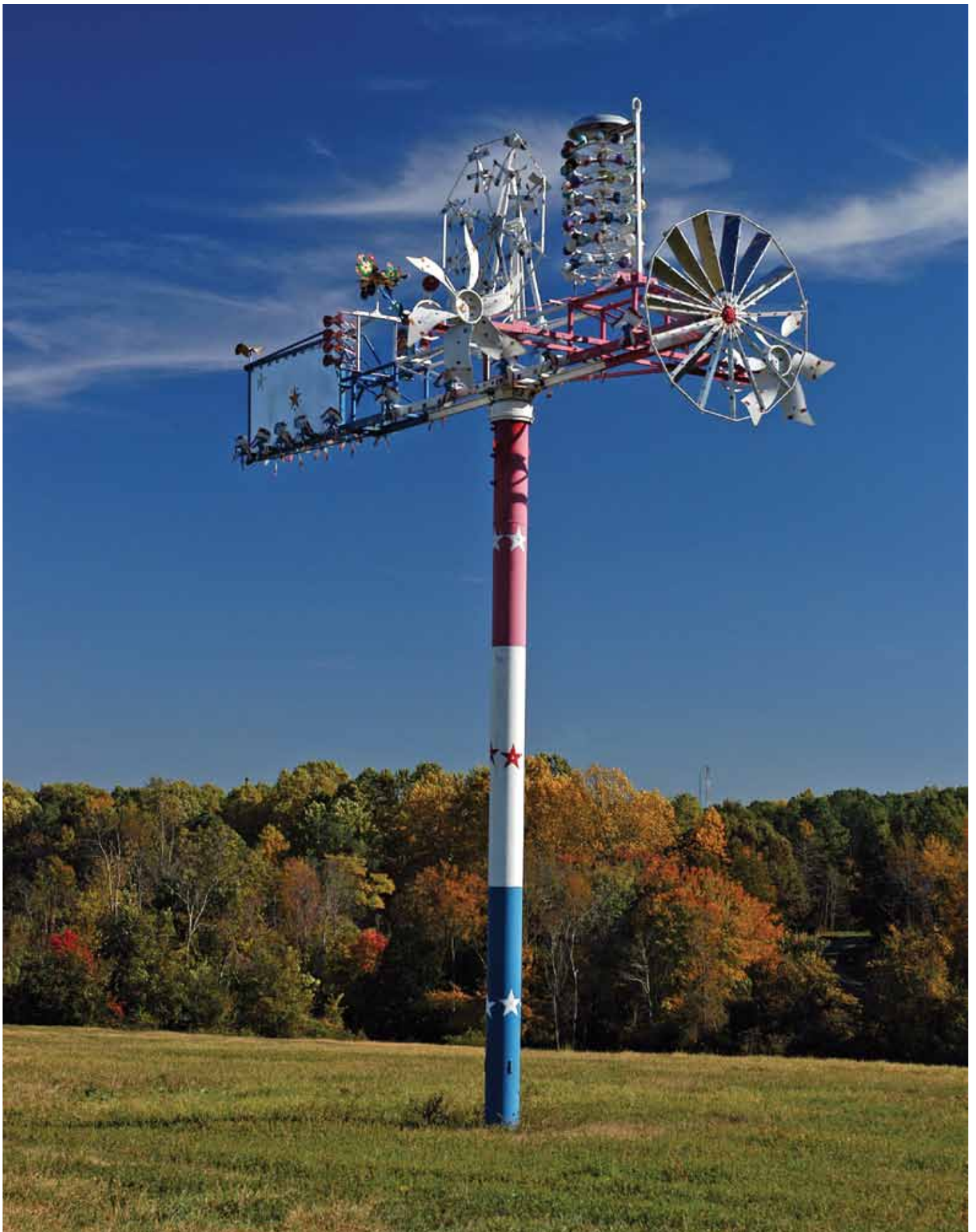
Vollis Simpson, Wind Machine , 2002, acero y otros medios, altura 30 × ancho 30 × profundidad 15 pies (aprox.), encomendado por el North Carolina Museum of Art con fondos del William R. Roberson Jr. and Frances M. Roberson Endowment Fund para el arte de Carolina del Norte