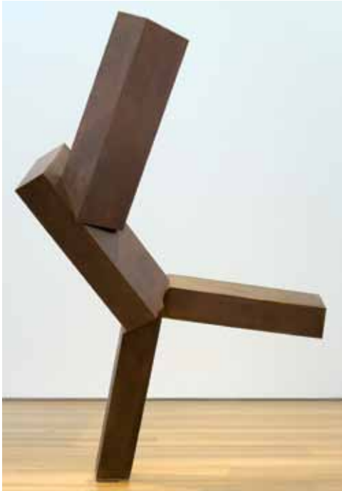
Joel Elias Shapiro, Sin título (detalle), 1989-1990, vaciado en bronce, altura 101½ × profundidad 42 × largo 78 pulg., comprado con fondos de varios donantes por intercambio