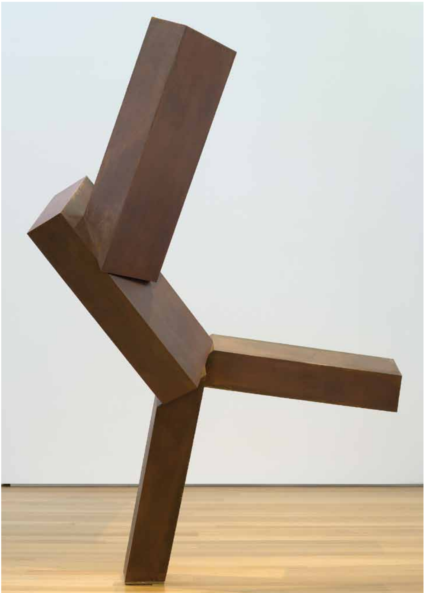
Joel Elias Shapiro, Sin título , 1989–1990, vaciado en bronce, altura 101½ × profundidad 42 × largo 78 pulg., comprado con fondos de varios donantes por intercambio